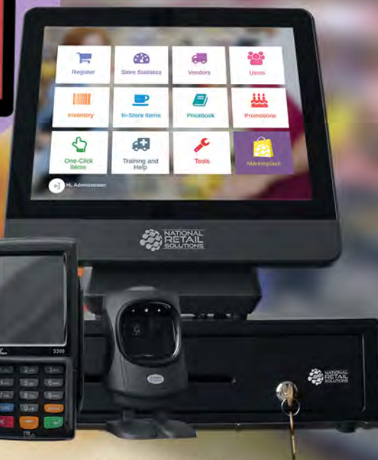
HARDWARE MAY VARY